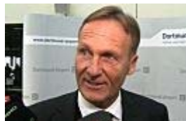
Watzke: "Özil ist das Tüpfelchen auf de...