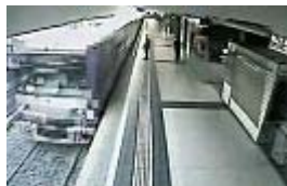
Sicherheitskamera filmt Zugunglück