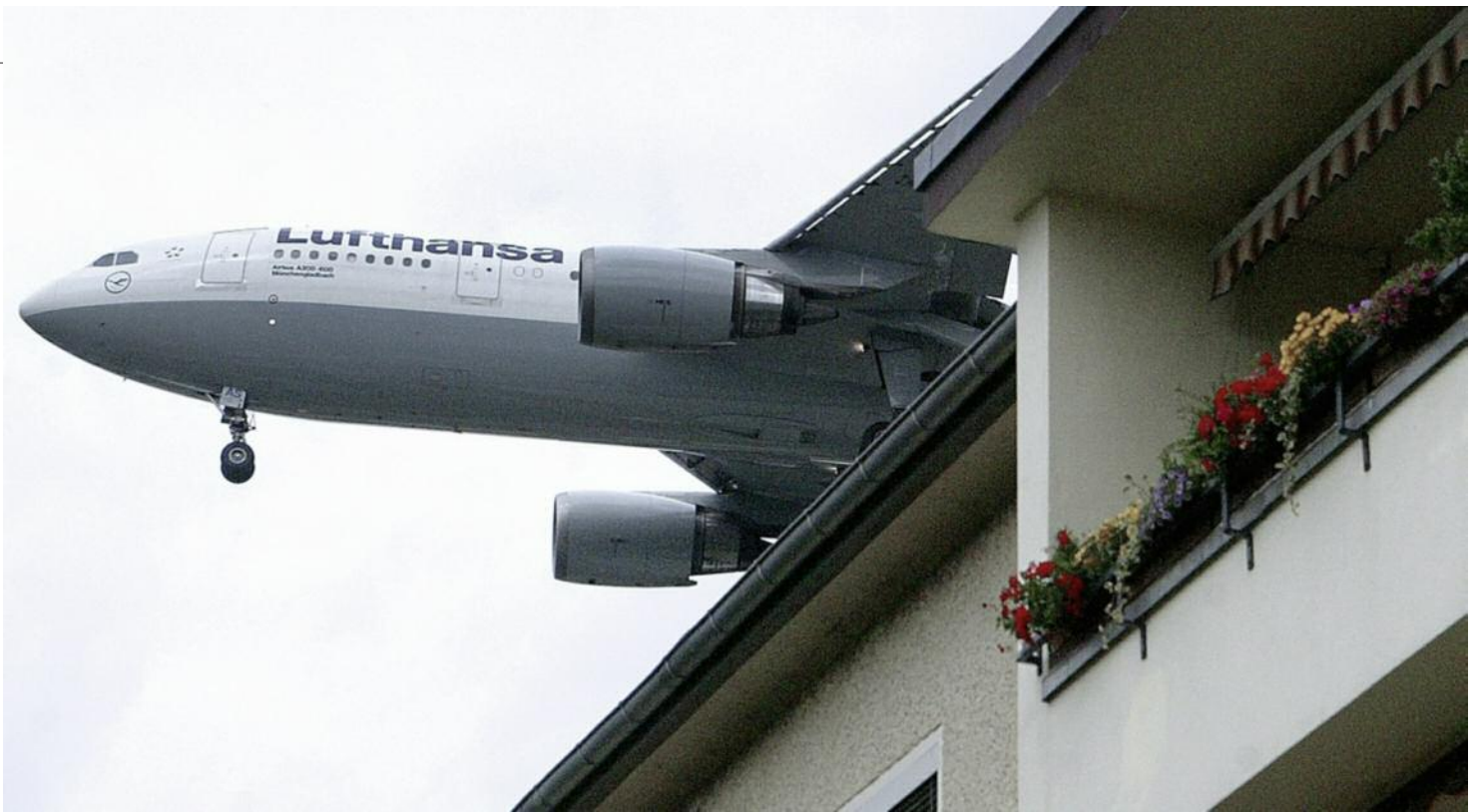
Jet im Landeanflug auf Berlin-Tegel: Bedrohliches Heulen und Donnern