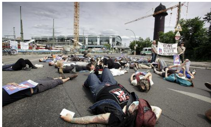
Protest gegen Stadtautobahn-Ausbau in Berlin: 4000 Herzinfarkte

einbauen lassen. „Ich schlafe oft unruhig, wache mehrmals nachts auf und gehe dann wie gerädert zur Arbeit“, sagt die Angestellte.