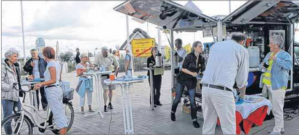
Hunderte Menschen haben sich schon am Infomobil der Allianz gegen die feste Fehmarnbelt-Querung über die Auswirkungen des Baus und der Hinterlandanbindung informiert.

SCHARBEUTZ. Auf der Tour durch die betroffenen Orte der Schienenhinterlandanbindung zur festen Fehmarnbelt-Querung hat das Infomobil der Allianz gegen die feste Fehmarnbelt-Querung in Scharbeutz und Haffkrug Halt gemacht.